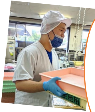
パン・クッキー製造