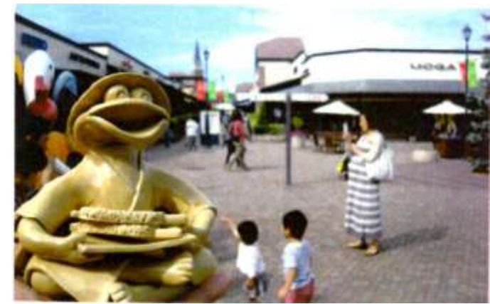
④土岐アウトレット

むかし話 山郷の川縁で陶工が、みの笠とみの のを身につけ、夏はふんどし姿で 陶土をつくっていた。また、童は 川で遊んでいた。 その姿が河童に 似ていたそうなの。