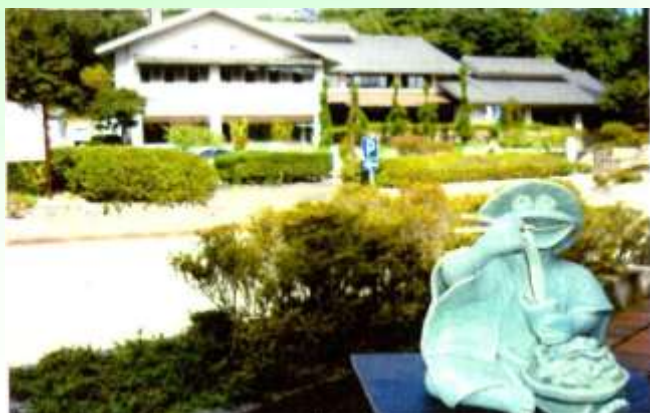
③ 美濃焼伝統産業会館