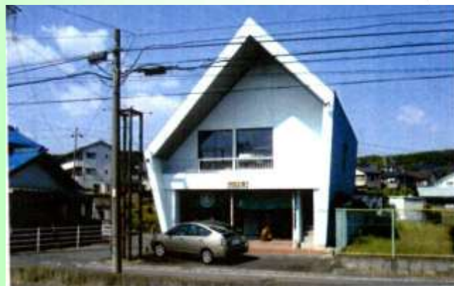
① 笑顔工房ギャラリー