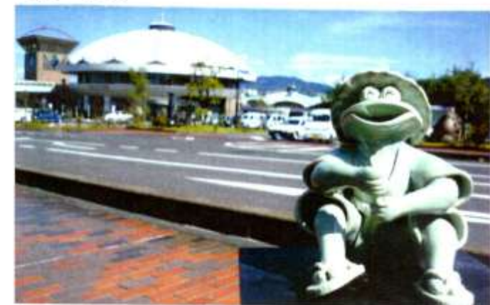
⑦道の駅 どんぶり会館