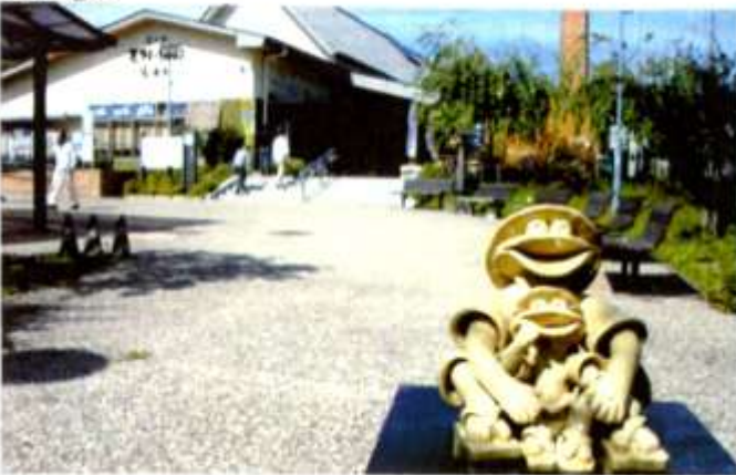
⑨道の駅 志野・織部