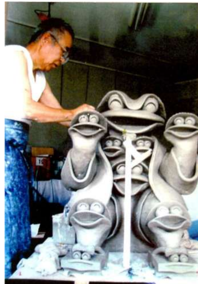
⑥ 日本ユーモア陶彫展 優秀賞受賞作品