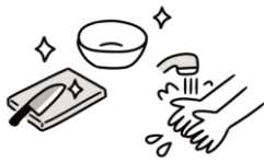
調理室での衛生管理