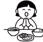
感謝の気持ちを育むマナー

給食の時間は、友達や先生と一緒に食べることで、協調性や社会性を育む大切な場です。「いただきます」「ごちそうさま」を通して、感謝の気持ちや食事のマナーを学びます。楽しい雰囲気の中で、食への興味を引き出し、自分で食べようとする意欲を伸ばします。