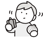
食べ物への興味・関心