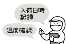
納入業者・食材の品質管理