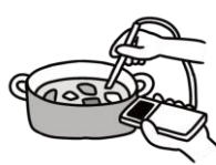
調理時の加熱の徹底（殺菌）