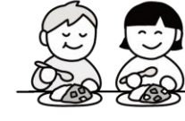
友達と一緒に食事を楽しむ